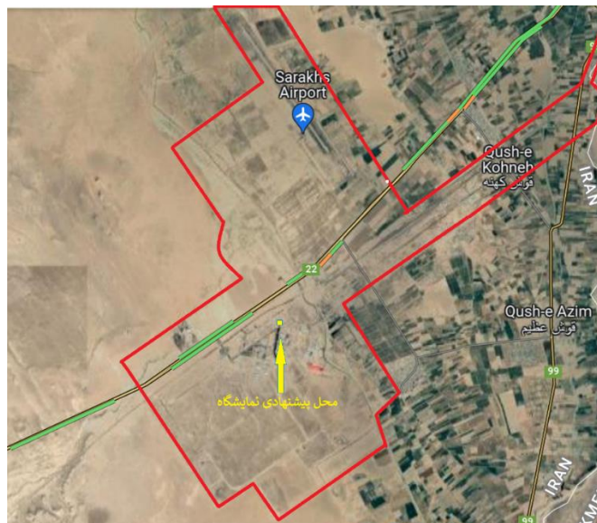
نقشه ۲- موقعیت سایت پیشنهادی نمایشگاه دائمی در منطقه ویژه اقتصادی سرخس