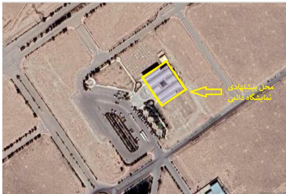
نقشه ۳- نمای نزدیک موقعیت سایت پیشنهادی نمایشگاه دائمی در منطقه ویژه اقتصادی سرخس